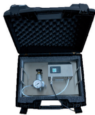
压缩空气质量检测