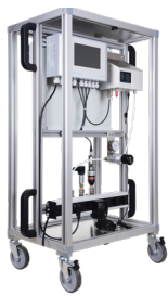
压缩空气质量检测