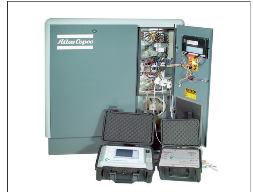
Exemple de mesure sur compresseur

Les données de mesure sont transmises numériquement (Modbus) aux DS 500/400 MOBILE dans lesquels elles sont enregistrées.