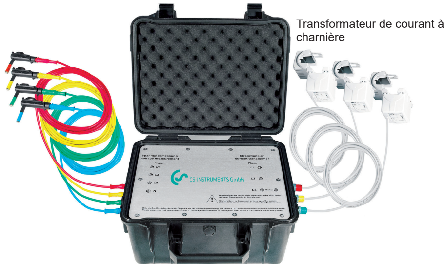
Transformateur de courant à charnière

Pointes de touche magnétique pour mesure de tension. Isolées électriquement