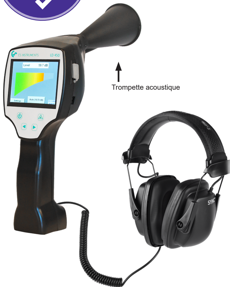
↑ Trompette acoustique