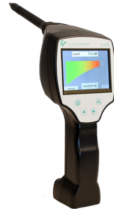
LD 450 avec le tube pointage pour une meilleur précision