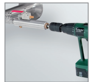
Perçage sous pression avec le dispositif de perçage CS

Grâce à un dispositif de perçage, il est possible de percer sous pression au travers du robinet à boisseau 1/2" dans une canalisation existante. Outil avec récupération des copeaux dans le filtre prévu à cet effet. La sonde peut ensuite être installée comme décrit au point 1.