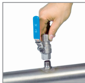
A Bossage fileté

B Installer un collier de prise, vendu avec un robinet à boisseau (voir la section Accessoires).