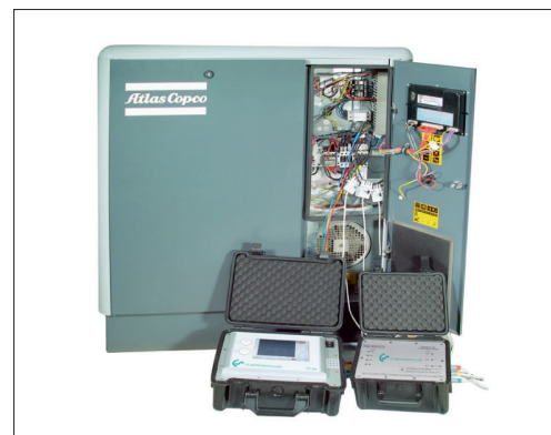
Ejemplo: medición en el compresor

Todos los datos medidos se transfieren en formato digital (Modbus) al DS 500 portátil / DS 400 portátil y se pueden almacenar ahí.