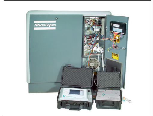
Esempio: misura su compressore

Tutti i dati di misura vengono trasmessi in modo digitale (Modbus) al DS 500 portatile / DS 400 portatile per essere registrati.