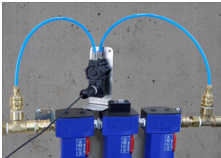
Tipico sito di impiego per la misura di pressione differenziale in collegamento con due tubicini in PE a collegati monte e valle del filtro.